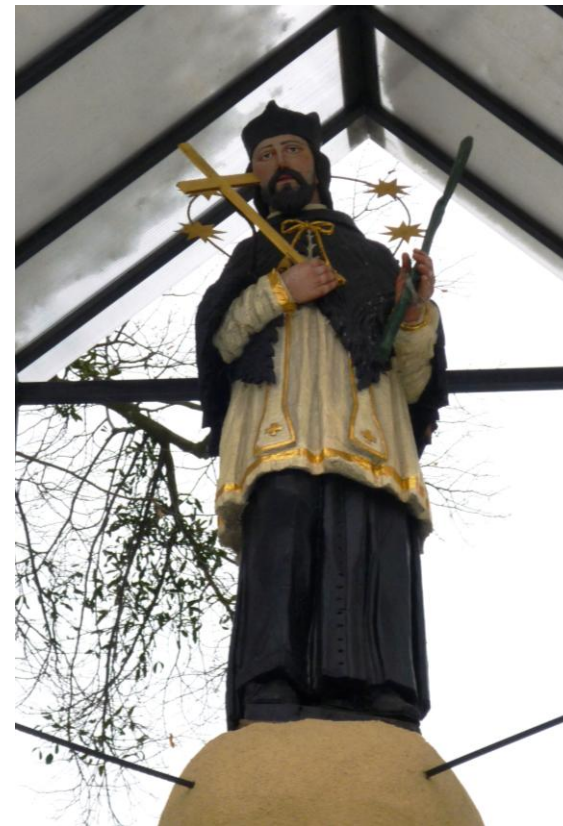
Pomnik Jana Nepomucena na skarpie nad Drwęcą