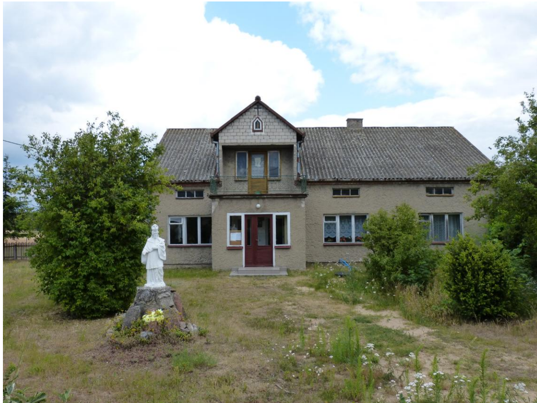
Kaplica we wsi Huta kilka kilometrów na południe od Skępego; przed kaplicą gipsowa figura Jana Nepomucen