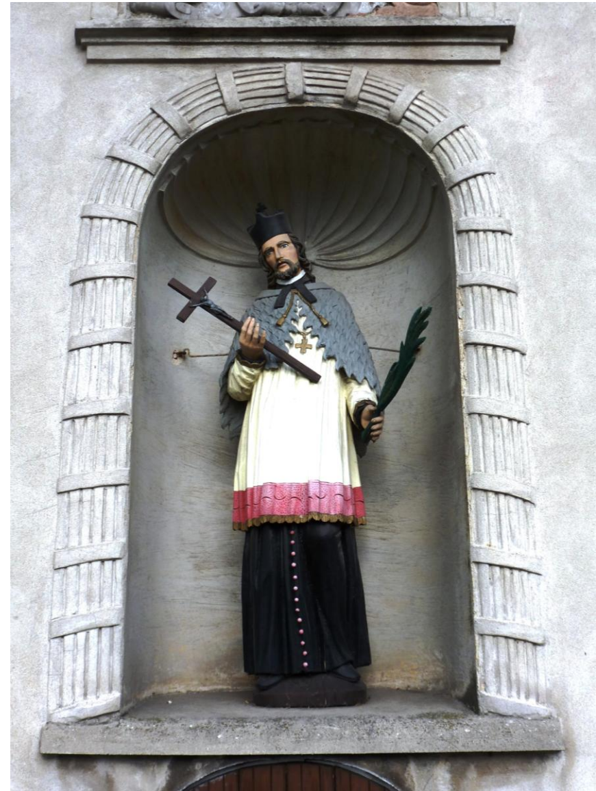
Kościół z 1584, zbarokizowany w 1761; figura Jana Nepomucena nad wejściem do kaplicy południowej