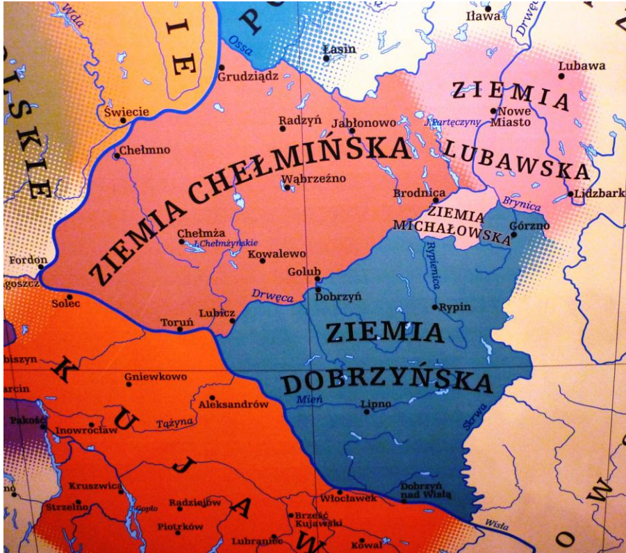
Mapa z Muzeum Etnograficznego w Toruniu

Granice Ziemi Dobrzyńskiej wyznaczają rzeki: Brzyca, Drwęca, Wisła i Skrwa. Z tak określonego terenu odpada Ziemia Michałowska, od czasów krzyżackich związana z Ziemią Chełmińską. Tropiąc nepomuki zwiedzimy kolejno: lewobrzeżne (względem Drwęcy) części powiatów toruńskiego i golubsko-dobrzyńskiego, gminy dobrzyńskie powiatu brodnickiego, całe powiaty rypiński i lipnowski (wszystko dotąd w województwie kujawsko-pomorskim) oraz prawobrzeżny (względem Skrwy) pasek województwa mazowieckiego.