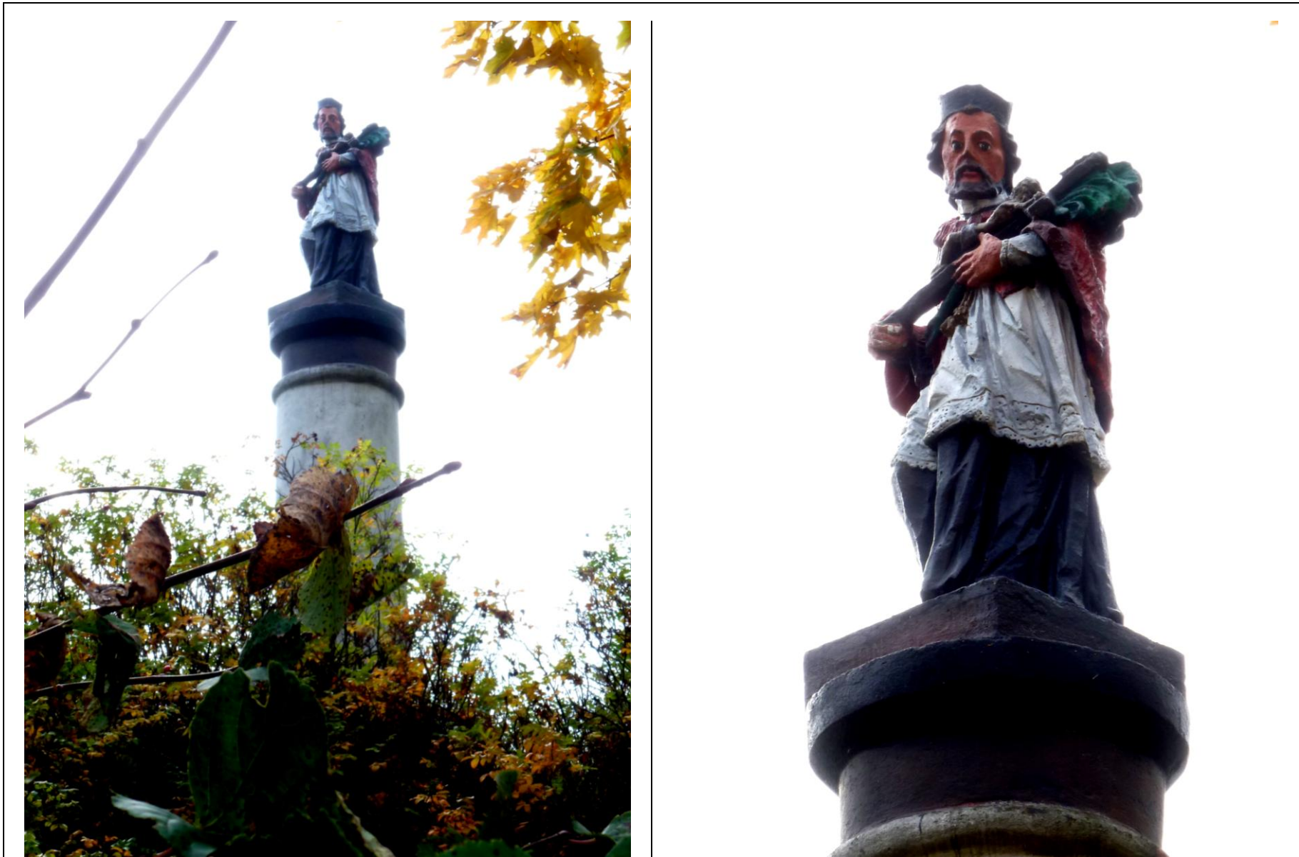
Figura Jana Nepomucena przy głównej drodze Toruń-Lipno, na wysokim kopcu od strony jeziora