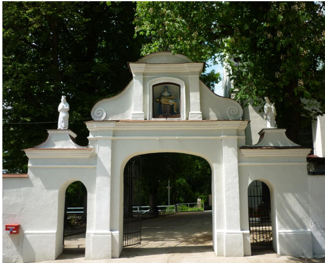
Brama wejściowa na teren klasztoru i sanktuarium; nad prawą furtką figura Jana Nepomucena