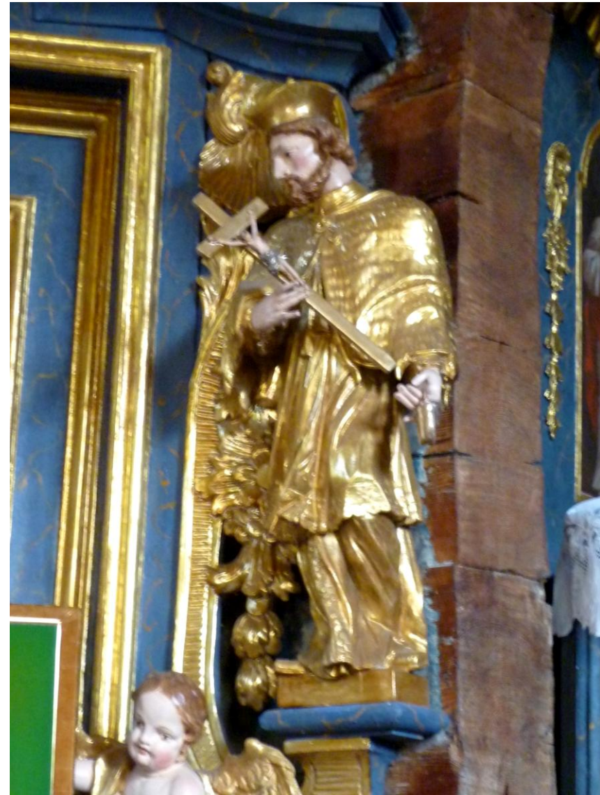
Figurą Jana Nepomucena w lewym ołtarzu bocznym w drewnianym kościele z roku 1750