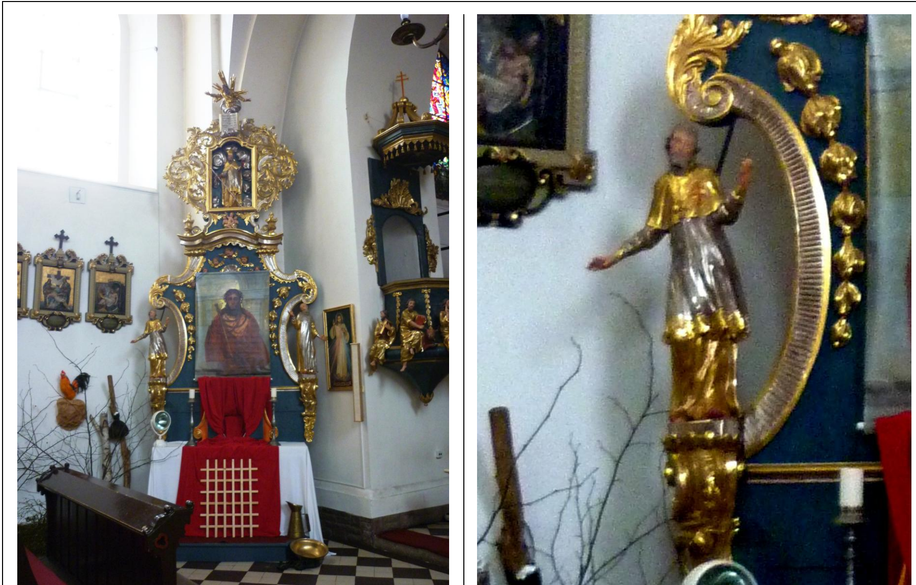
Kościół bożogrobowców z 1765-1812; figura Jana Nepomucena z lewej strony lewego ołtarza bocznego