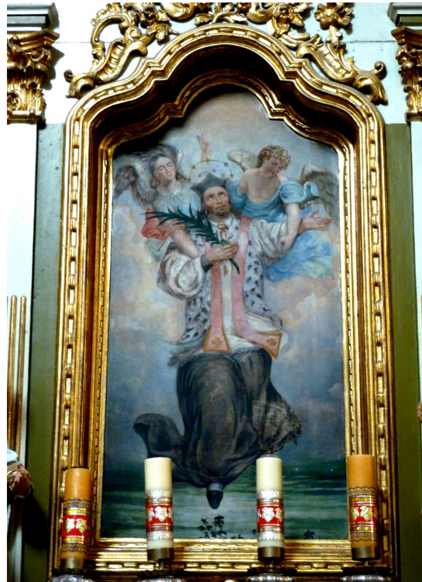
Ołtarz Jana Nepomucena w sanktuarium MB Skępskiej przy klasztorze bernardynów