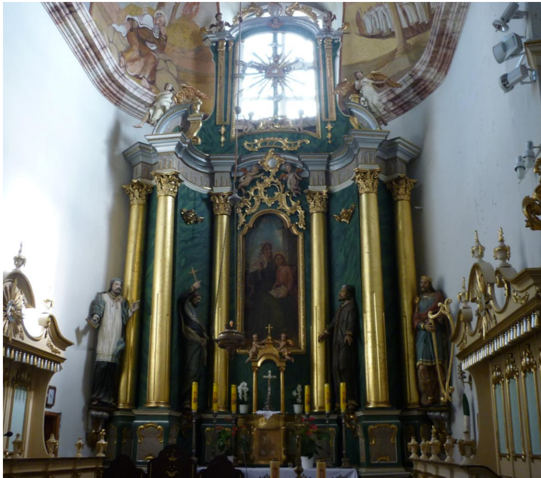
Ołtarz główny w barokowym kościele św. Anny 1725-38; figura Jana Nepomucena z lewej strony ołtarza