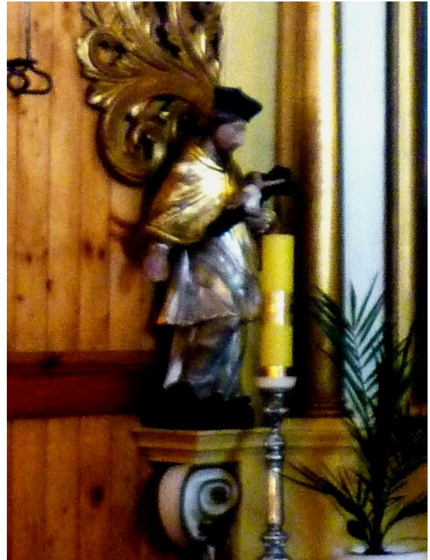
Kościół drewniany z 1737, rozbudowany 1878; figura Jana Nepomucena z lewej strony ołtarza św. Tekli