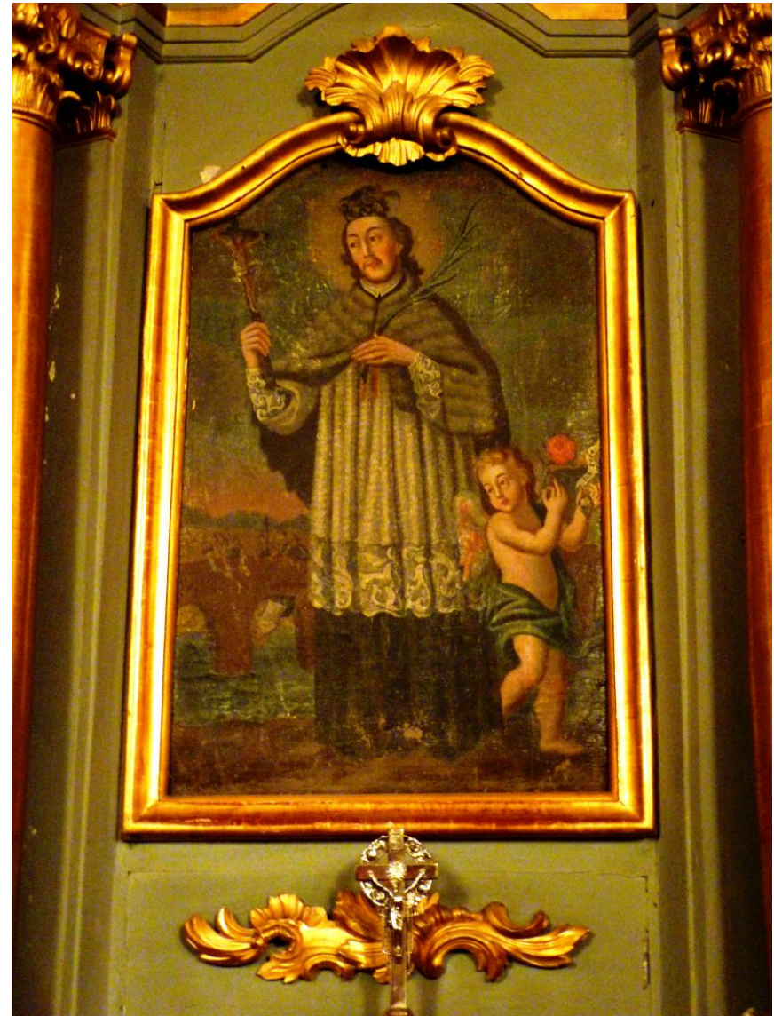
Obraz Jana Nepomucena w bocznym ołtarzu barokowego kościoła Jana Chrzciciela z lat 1752-56