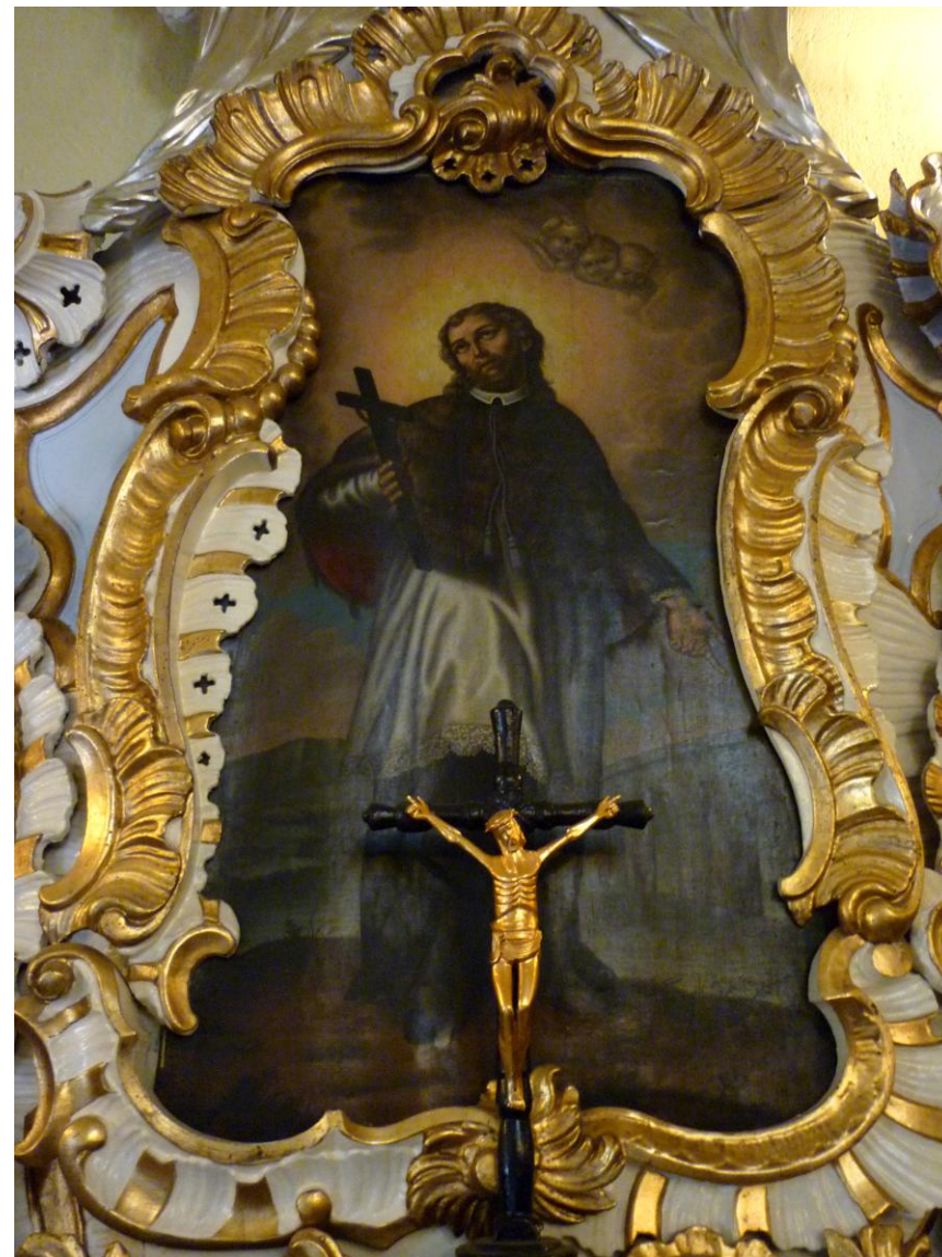
Ołtarz Jana Nepomucena w lewej nawie świątyni