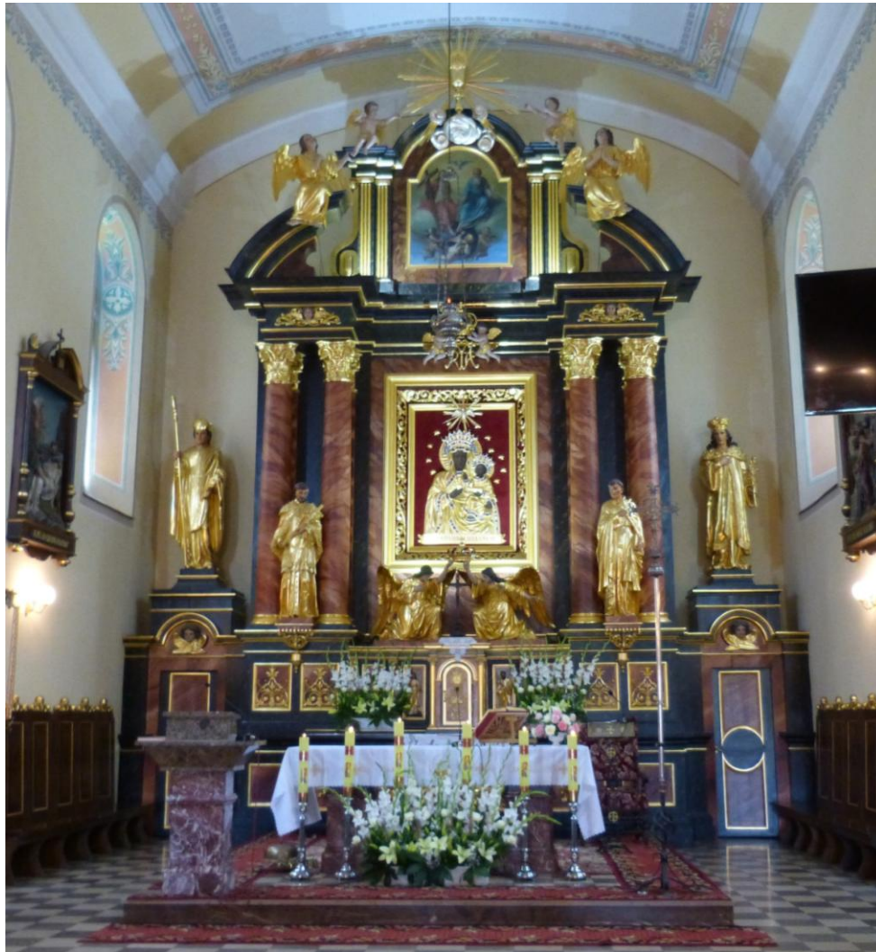
Kościół klasycystycznym z 1852, rozbudowany w 1888-94; Jan Nepomucen przy lewych kolumnach ołtarza głównego