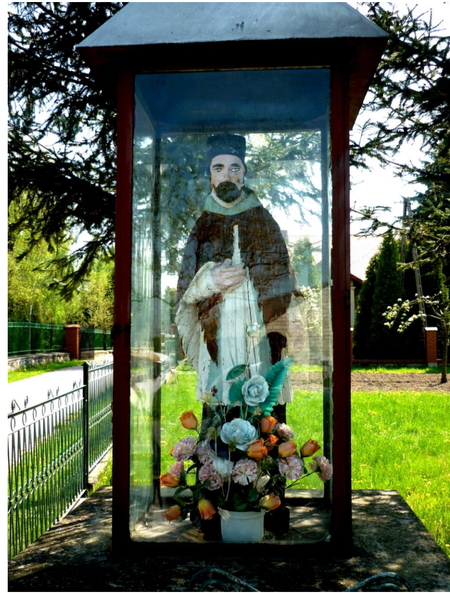
Kapliczka z figurą Jana Nepomucena w pobliżu neogotyckiego kościoła z roku 1893