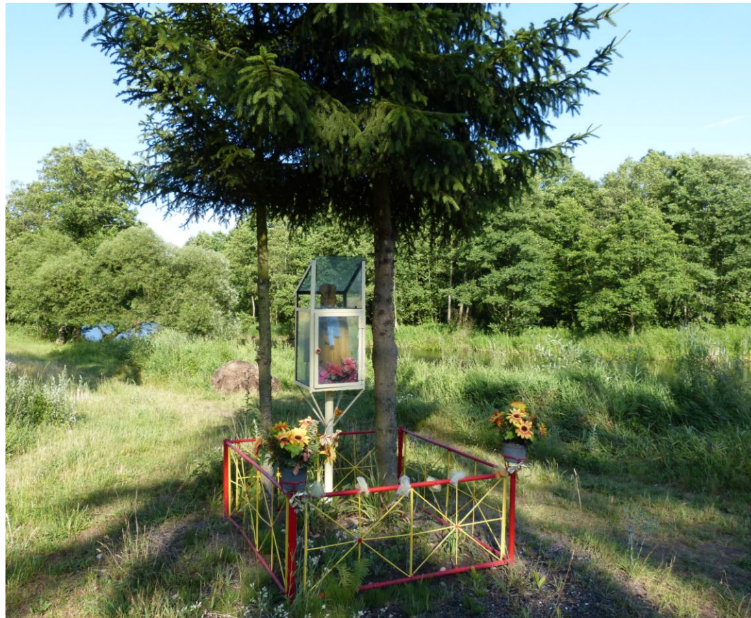
Bardzo zniszczona drewniana figura Jana Nepomucena, na prawym brzegu Skrzy, w pobliżu zabytkowego młyna