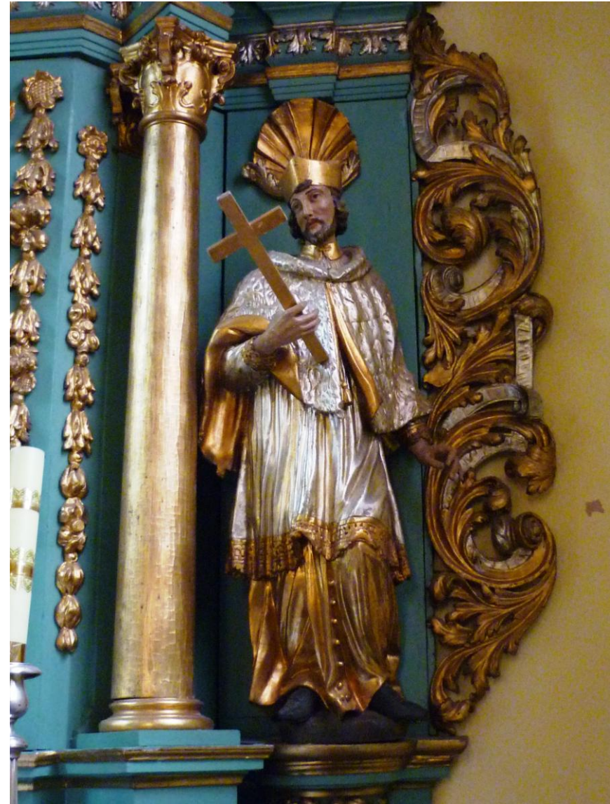
Ołtarz w kaplicy Opatrzności Bożej; z prawej strony ołtarza figura Jana Nepomucena