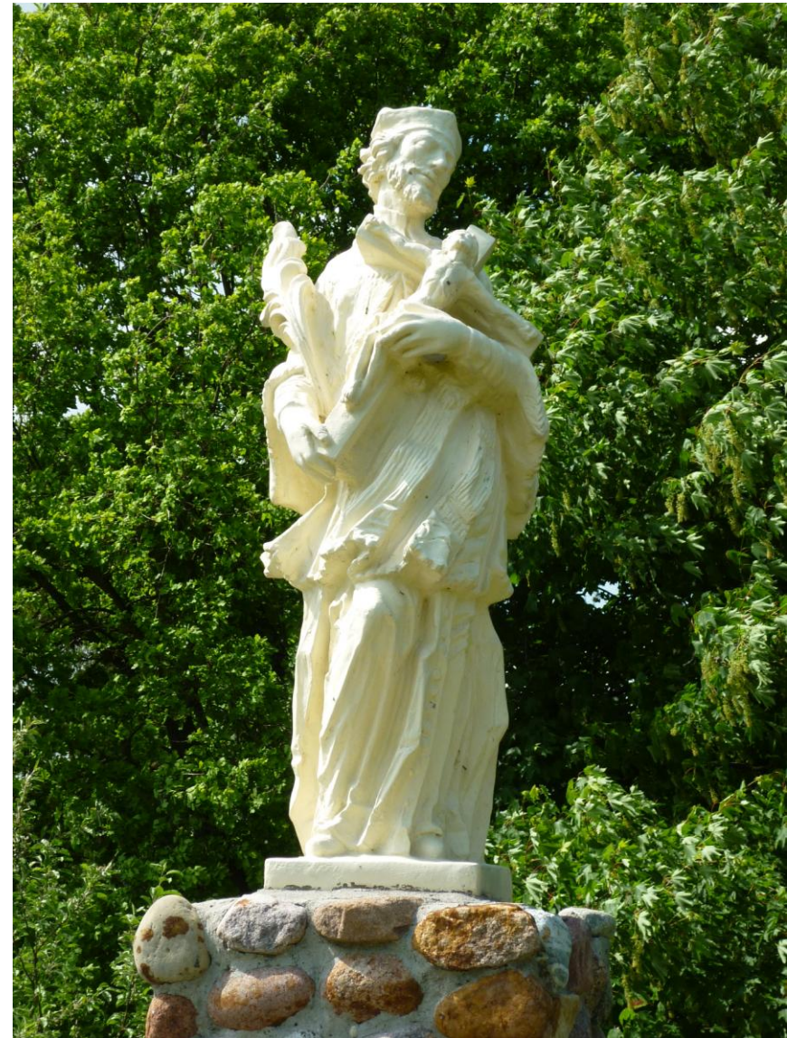
Figura Jana Nepomucena w ogrodzie klasztornym